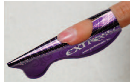
3. A szögletes formának megfelelően a legújabb, különleges formájú Extrém sablon felhelyezése.