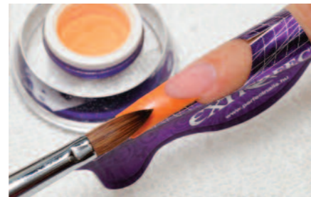
5. Mandarin színű porcelánporból (#108-as) a szabadszél kialakítása.