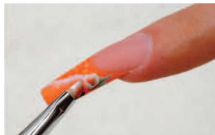
10. Akril festékekkel és ferde egylendület ékszerecsettel a minta elkészítése.