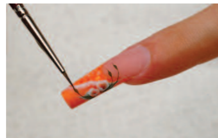
11. 300/1-es ecsettel indák kialakítása.