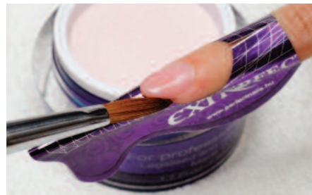
4. Perfect Masque Pink porcelán porból 12-es Diamond ecsettel a körömágy-hosszabbítás elkészítése.