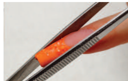
8. Hajlítócsipesszel kecsesítjük a körmöt.