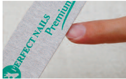
1. A szarupárkány és a letapadt részek feltolása után 180-as Prémium reszelővel a természetes körömlemez rövidítése és mattítása.