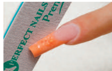
9. 180-as Prémium reszelővel a köröm formájának és felületének kialakítása, 150-es bufferrel a felület finomítása.