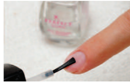
2. Perfect Prep körömelőkészítő, és a tökéletes tapadás érdekében Perfect Bond „folyékony tapadófilm” használata.