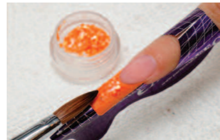
6. Narancssárga törtkagyló helyezése a színes végre.