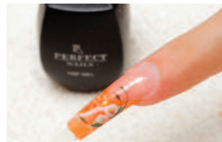
12. A köröm fényét a fixálás mentes Perfect Top Gel adja vissza.