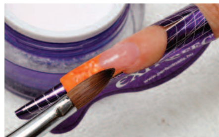
7. Perfect Speed Pink porral a köröm borítása és a C ív kialakítása.