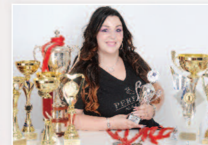
DARABOS ÉVI háromszoros Európabajnok és olimpiai bajnok

12. A köröm fényének visszaadása Perfect Top Gel-el, majd 3 percig köttetés UV lámpában.