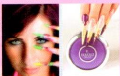
Szabó Niki Országos díszítő bajnok