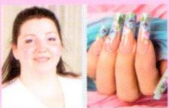
Darabos Évi Winner of winners London, Olimpiai és Európa bajnok