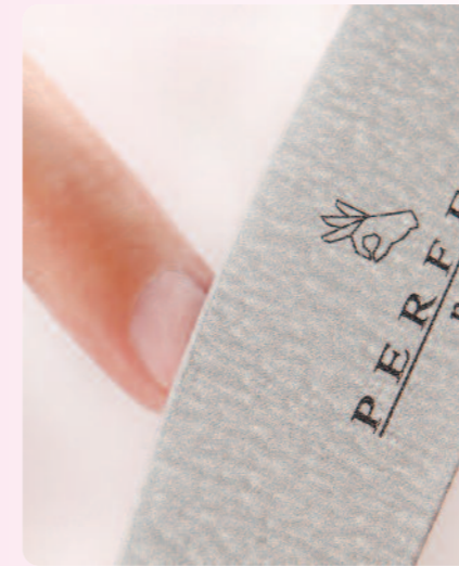
1. A természetes köröm előkészítése után „No Primer Liquid”-del dolgozom, így nem kell primert használni.