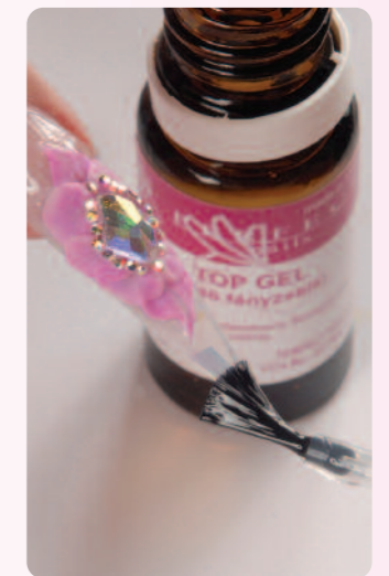
10. Perfect Top Gel segítségével megadom a végleges fényt.