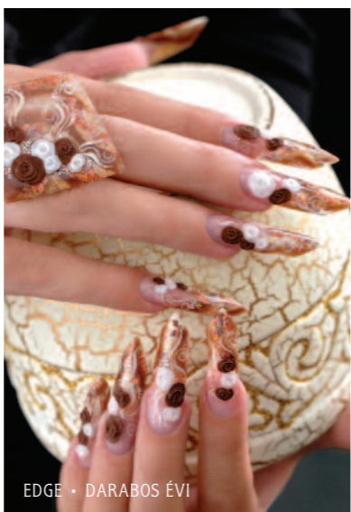
EDGE • DARABOS ÉVI