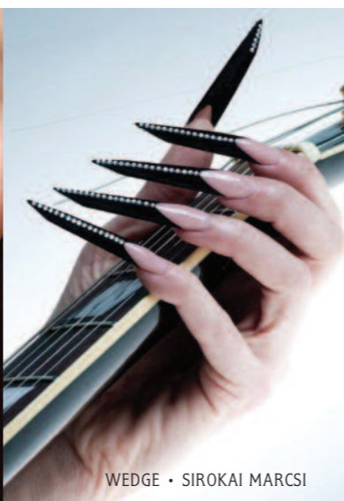
WEDGE • SIROKAI MARCSI