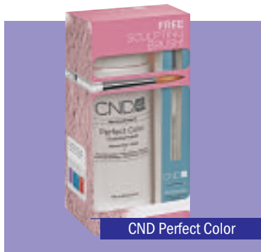
CND Perfect Color

További információ: www.cesarsecret.hu ; evamatyas@cesarsecret.hu ; 06/20-524-7153